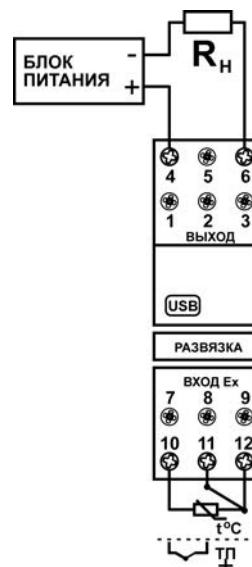
Рисунок 3.1 – Схема подключения преобразователя