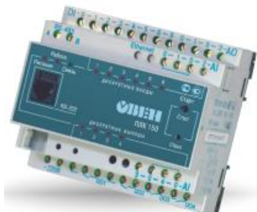
Рис.1 - Общий вид контроллеров логических программируемых ОВЕН ПЛК150

Фотографии общего вида контроллеров приведены на рисунках 1 и 2.