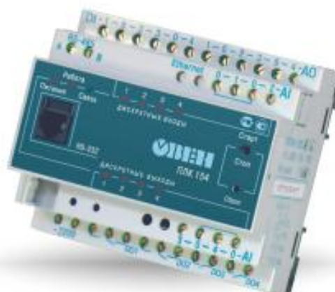
Рис.2 - Общий вид контроллеров логических программируемых ОВЕН ПЛК154